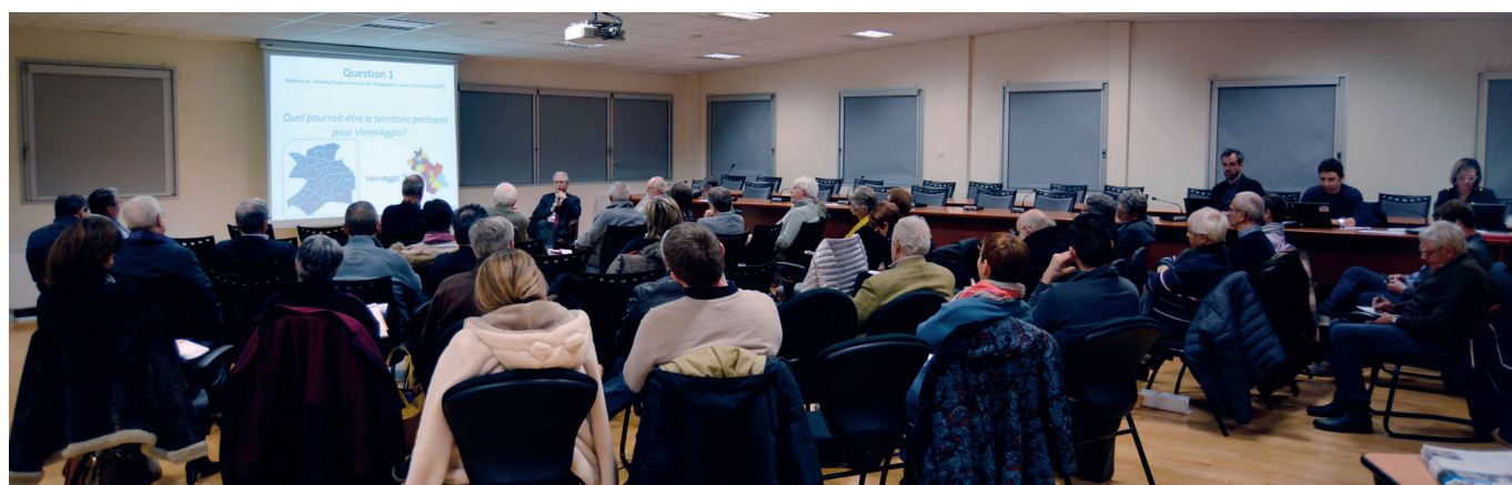
Séance Plénière du 17 janvier 2017 ouverte au public.

Renseignez-vous auprès de la Chargée de Mission au 04 82 06 33 23 et rejoignez le Conseil.