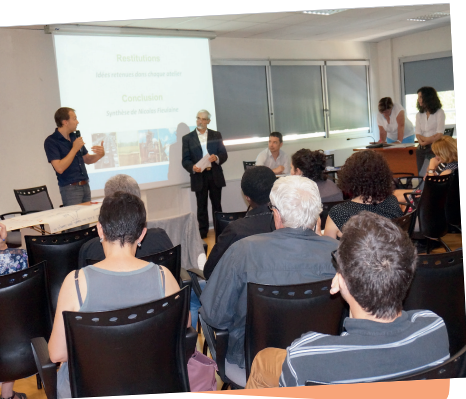
Rencontre d'acteurs du 23 juin 2016.