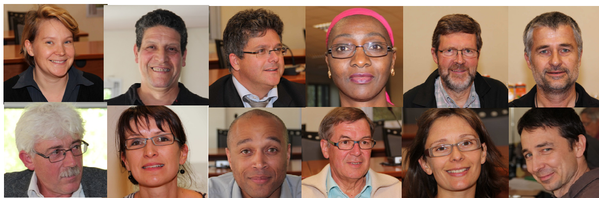
Quelques membres du Conseil de Développement