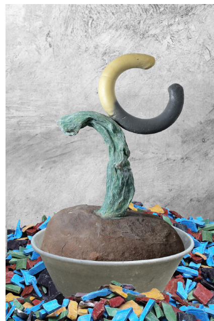
Sculpture de Jacques Julien

de Jacques Julien évoquent tout autant les icônes du sport que les contes pour enfants, le dessin animé que des histoires fantasmagoriques. Ces références lui servent de point d'appui pour des digressions spatiales et formelles.