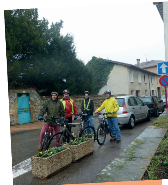
Membres du CdD en étude à Eyzin Pinet

sur les Risques, l'Environnement, la Mobilité et l'Aménagement (CEREMA) pour s'informer sur les évolutions réglementaires, le CdD étudie des propositions d'expérimentations réalisables à faible coût sur 4 communes du territoire. Ces dernières seront exposées dans l'avis prévu pour la fin du premier semestre 2016.