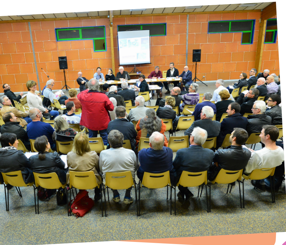
Réunion publique le 5 novembre 2015 aux Côtes-d'Arey