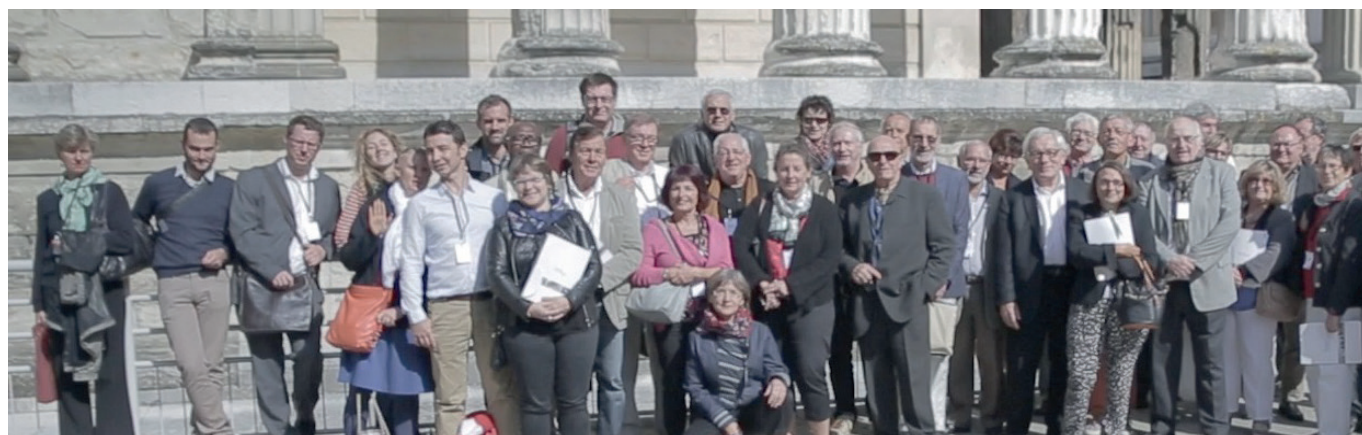
Les membres des quatre Conseils de Développement du Pôle Métropolitain en découverte du Pays Viennois

Pour le Conseil de Développement, la culture est un facteur central pour développer l'identité du territoire. Le CdD pourrait envisager de mener une nouvelle réflexion sur la notion de sentiment d'appartenance.